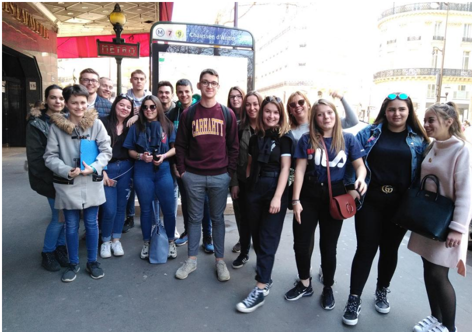
Les élèves de Terminale Commerce devant les Galeries Lafayette, boulevard Hausmann